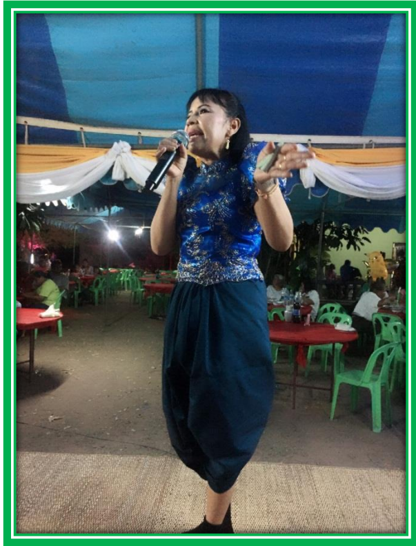
สำลี บ้านไพล