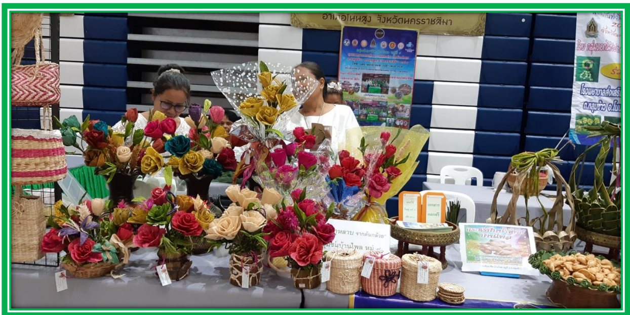
2.การทำผลิตภัณฑ์เสื่อกก ของหมู่บ้านหลุมข้าวพัฒนา หมู่ที่ 15 ตำบลหลุมข้าว อำเภอนนสูง จังหวัดนครราชสีมา